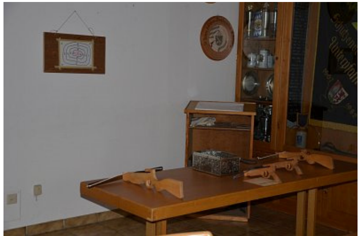
Willi Tell lässt grüßen