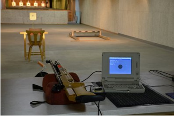
Lichtgewehrschießen für die Kleinen (bis 11 Jahre)

Vielen Dank an alle Helfer, speziell auch für die Kuchenspenden.