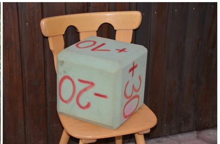
Glückswürfel (da konnte man auch wieder Punkte verlieren)