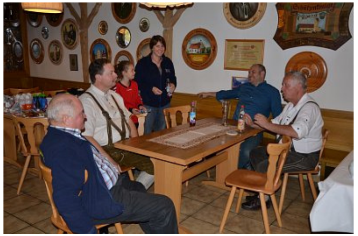
Mitarbeiter (bevor es losging noch ziemlich entspannt)