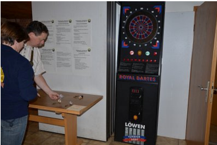
Darten (früher "Spickern")