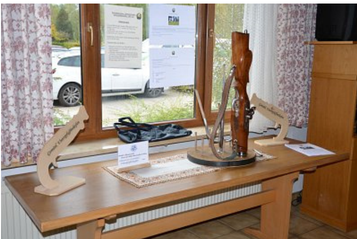
Und eine Abordnung unserer Böllerschützen