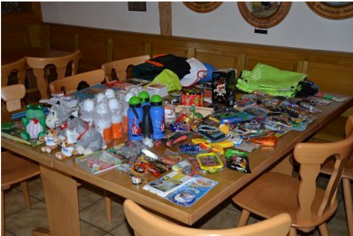
Die Preise (im wesentlichen für die jungen Teilnehmer gedacht)