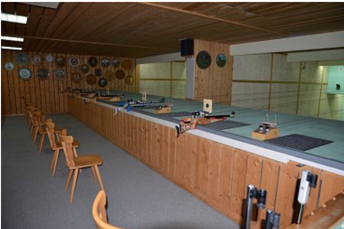
Luftgewehrschießen für die Älteren (ab 12 Jahre)