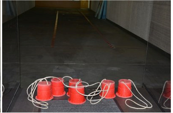
Eimerlaufen (für alle, die sich's zutrauen)