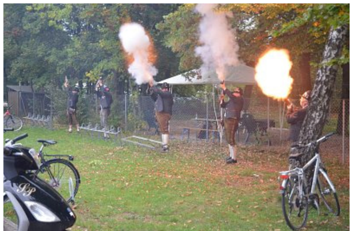
ließ es auch ordentlich krachen.