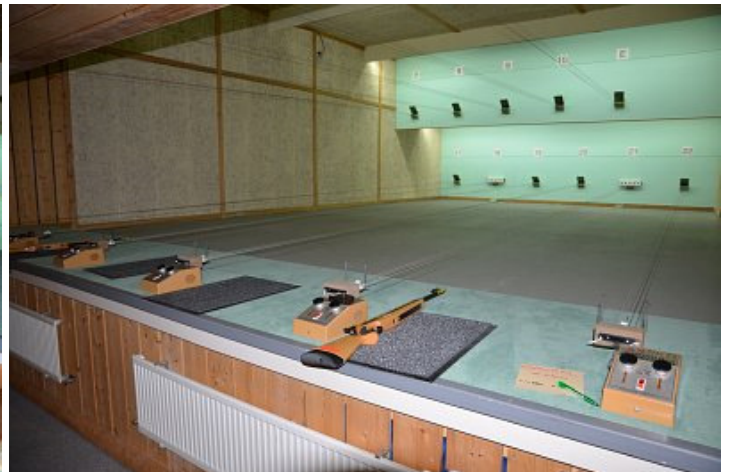
Laserbiathlon (auch für alle)