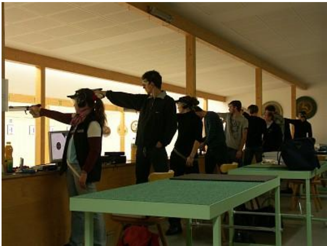
Gegen Oberpfaffenhofen und...

Seit heuer wird bei der HSG auf neue Elektronikstände geschossen. Das Zielbild (Scheibe) wurde von einigen Schützen als zu grell empfunden.