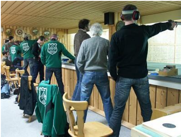
Asbach-Bäumenheim - Oberpfaffenhofen