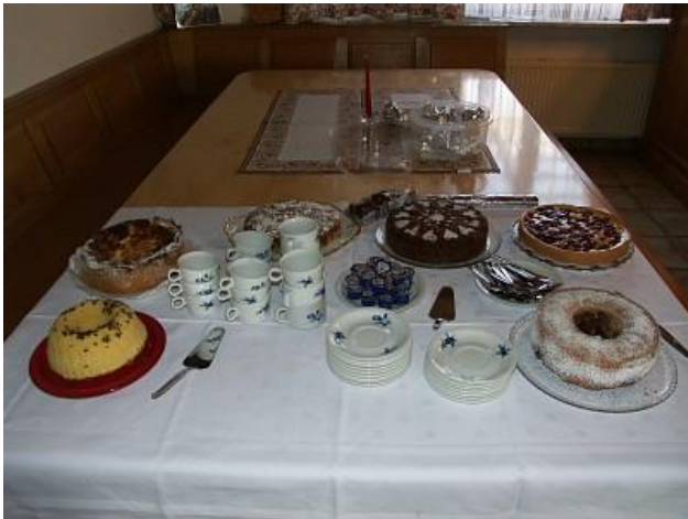
Zur Stärkung gab es ein gut bestücktes Kuchenbuffet.