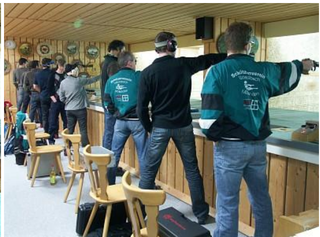
Oberpfaffenhofen - Ustersbach-Mödishofen