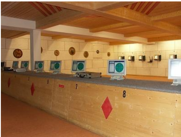
Besichtigung der Arena

Die nächsten beiden Kämpfe finden am 16.01.2011 bei uns gegen Asbach-Bäumenheim (4. Platz, 6:10 Punkte) und Ustersbach-Mödishofen (7. Platz, 4:12) statt.