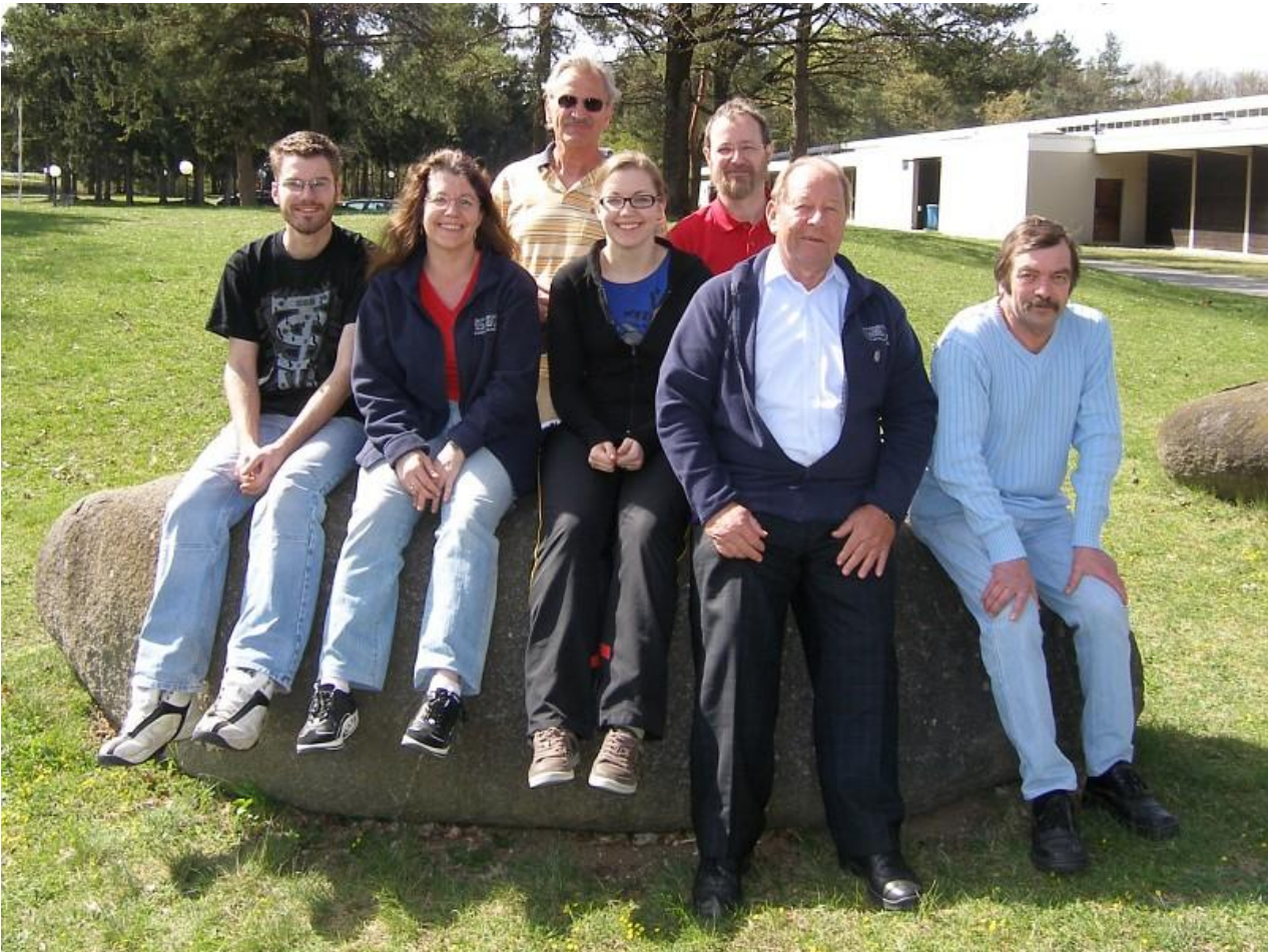
Zum erfolgreichen Abschluss der Saison noch ein Erinnerungsfoto mit den beiden "Dauerfans", die bei jedem Kampf dabei waren.