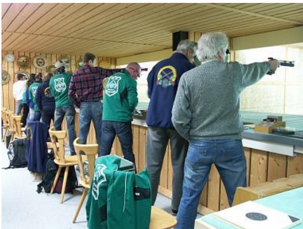
Unterpfaffenhofen - Asbach-Bäumenheim

Da hat sich's tatsächlich einer am Stand richtig bequem gemacht.