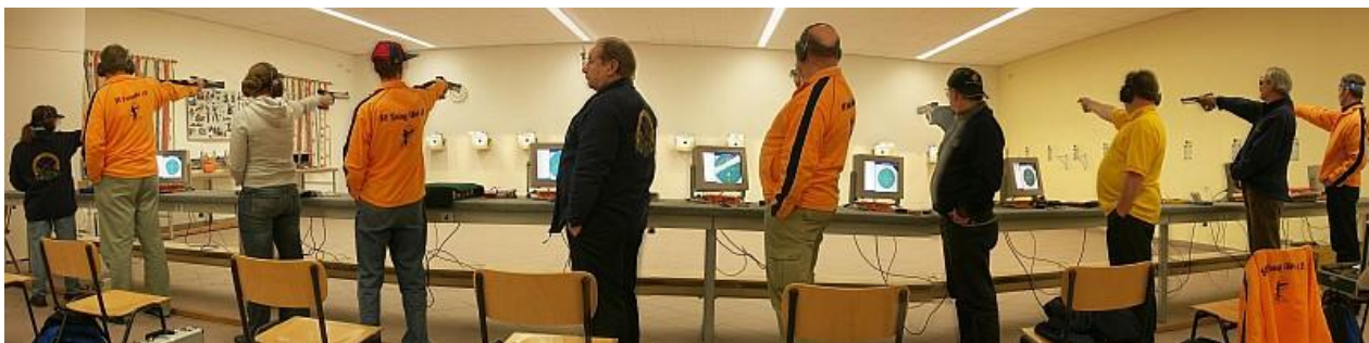
Wettkampf in Asbach-Bäumenheim (Archivbild aus 2009)

Diesmal gibt's leider keine aktuellen Bilder, aber nachdem bei den Bildern auch immer ein kurzer Bericht zu finden war, gibt's wenigstens den.