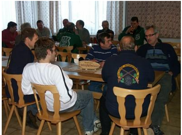
Nach dem Kampf ist vor dem Kampf.