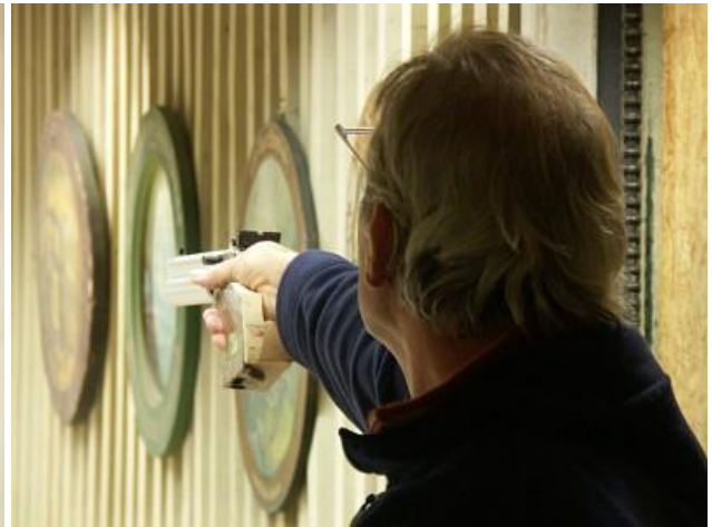
Sigi auf 5 konnten beide 2x einen Punkt zu den Siegen beisteuern.