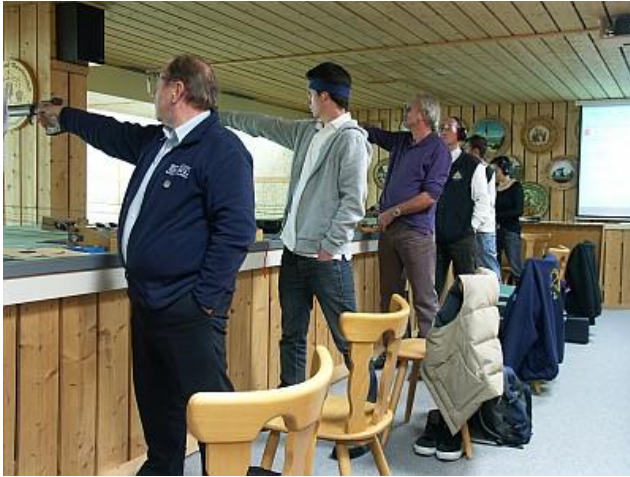
Der harte Kampf um die begehrten Punkte...