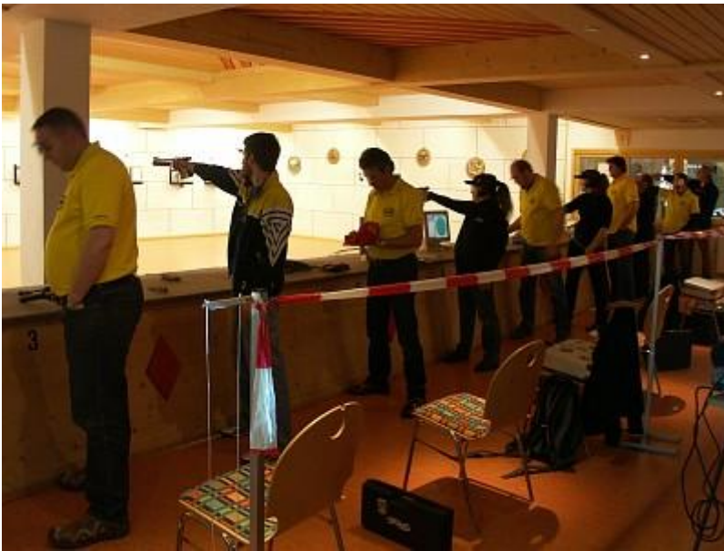
Vorbereitung auf die letzten beiden Kämpfe der Saison.