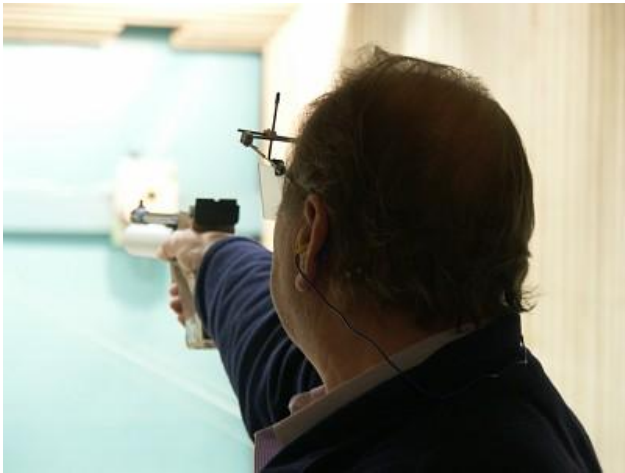
Sepp auf 4 und