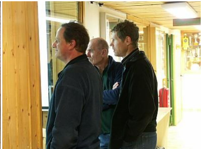
Zeitweise haben sich aber unten am "Schaufenster" doch auch ein paar Nicht-Wettkämpfer über den Fortgang des Schießens informiert.