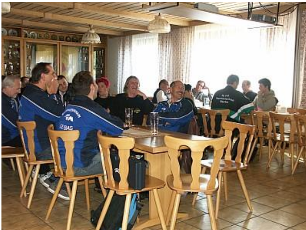
Zuschauer im Schützenheim. Leider wieder einmal fast nur Wettkampfteilnehmer.