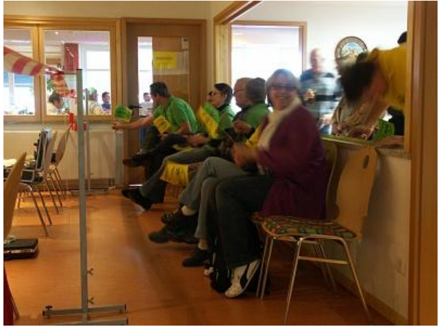
Es waren sogar Zuschauer mit Ratschen und Kuhglocke da. Stimmung fast wie bei der Bundesliga :-)