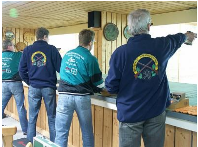
Ustersbach-Mödishofen - Unterpfaffenhofen