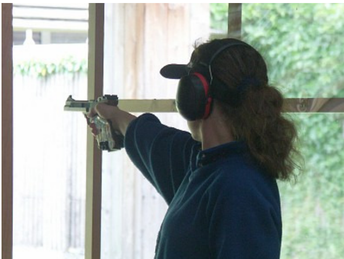
Die Lehrbuchanschläge Präzision