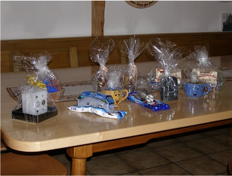
Es gab natürlich auch etwas zu gewinnen