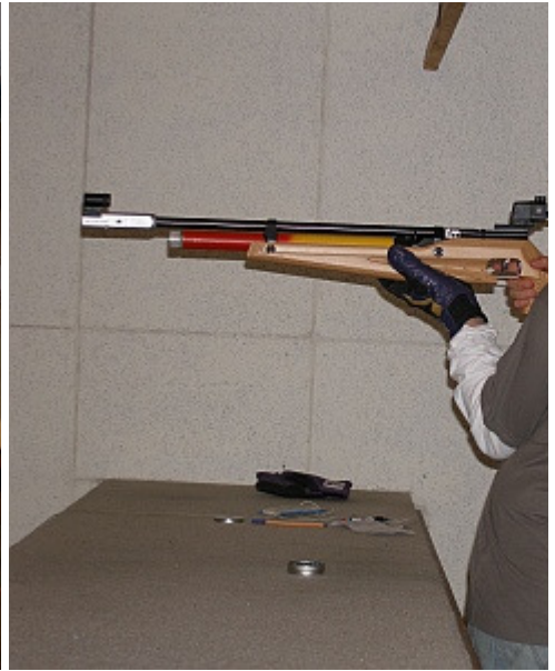
gut gezielt ist schon mal halb getroffen die andere Hälfte macht dann die Übung