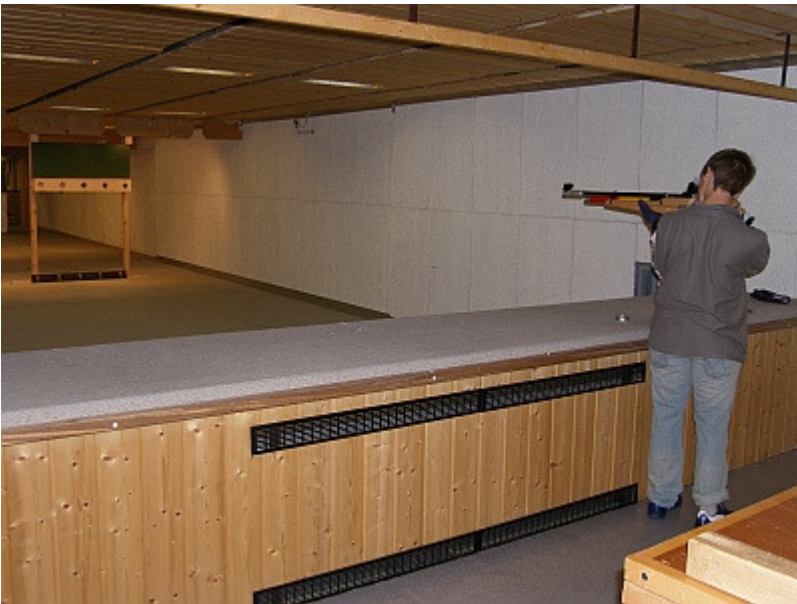
an der Klappscheibenanlage (wie beim Biathlon)